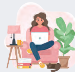
stay home 家で過ごす