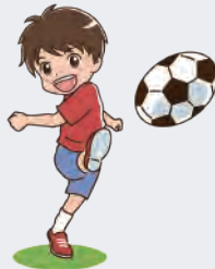
play soccer サッカーをする