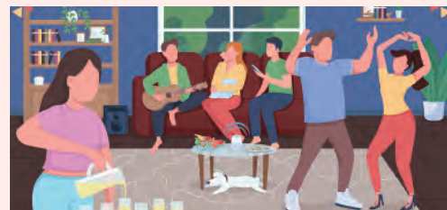
hang out with my friends 友だちと遊ぶ