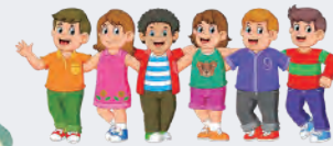
go out with my friends 友だちと出かける