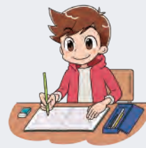
do my homework 宿題をする