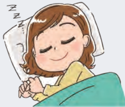
get some sleep 睡眠をとる