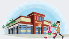
go shopping 買い物に行く