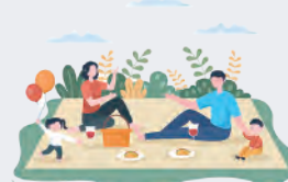
spend time with my family 家族と過ごす