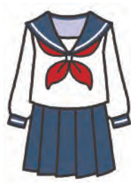
sailor-style blouse and skirt セーラー服