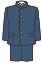
blazer with a stand-up collar 詰襟学生服