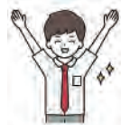
dress shirt ワイシャツ