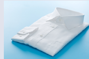
T-shirt / Dress shirt Ｔシャツ