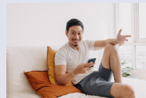
Indoor clothes 部屋着

Sweater, Blouse, Skirt, Pants, Shorts, Jeans, Sneakers, Jacket, Pajamas