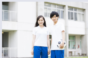
P.E. Uniform 体育着