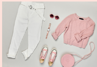
outfit アウツフィット 装い