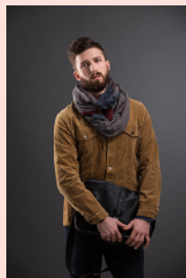
stylish スタイリッシュな