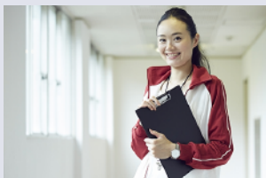
Track Suit ジャージ