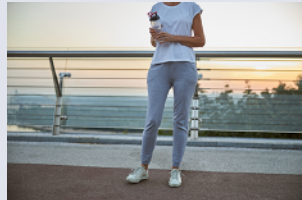
Sweatshirt / Sweatpants スウェット