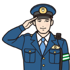
Mark I am a _____.