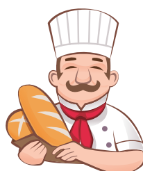
Troy I am a _____.