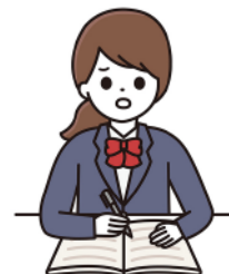
Grace I am a _____.