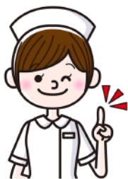
Tina I am a _____.