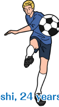
Toshi, 24 years old