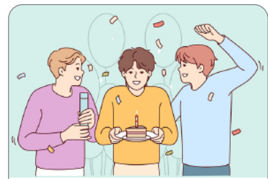
Celebrate with friends