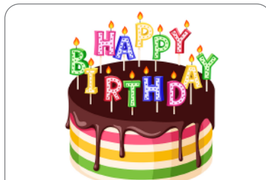
Buy a cake