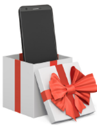
the newest smartphone