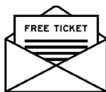
a concert ticket