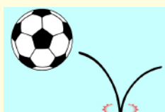
bounce (ボールなどが)跳ねる