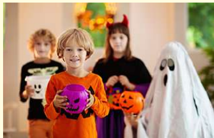
trick or treat