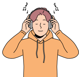
listen to music