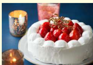
sponge cake with strawberry and cream (クリスマスケーキの説明)