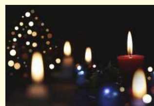
special Christmas service クリスマス特別礼拝