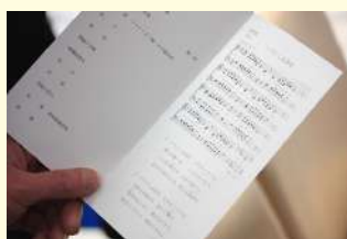
hymn [hɪm] 讃美歌