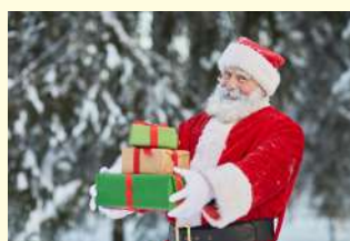
Santa Claus [s'æntəkl'ɔ:z] サンタクロース