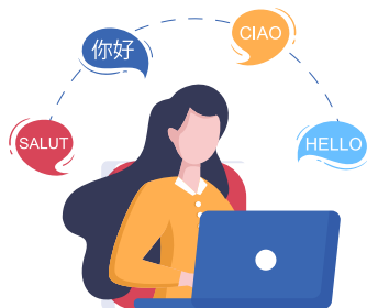
speak another language