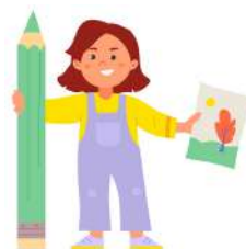
DONA drawing pictures 6 years