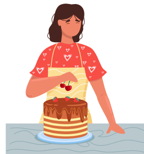
bake a cake