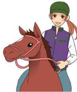
ride a horse