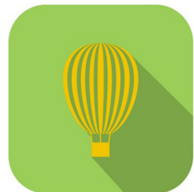
hot air balloon