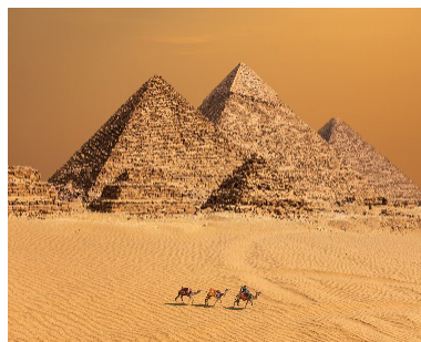
GREAT PYRAMIDS OF GIZA Egypt