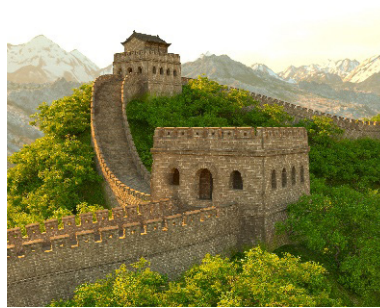
Great Wall of China