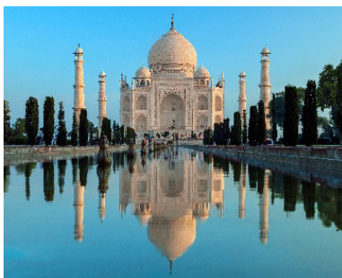
TAJ MAHAL India

3つのランドマークを、1（いちばん行きたい場所）から3（あまり行きたくない場所）まで順位づけてください。そのあと、なぜそう思うのか先生に説明してください。