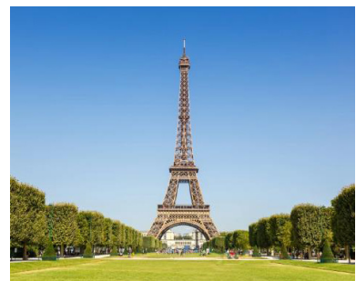
EIFFEL TOWER France